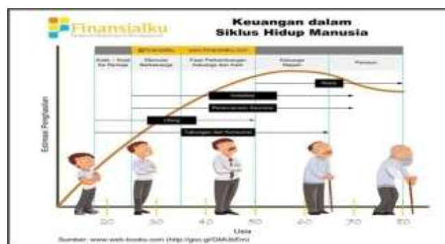
Gambar 2: Keuangan dalam siklus kehidupan manusia

Dalam gambar di atas dijelaskan bahwa ketika memasuki masa produktif, penghasilan seseorang akan mengalami peningkatan sejalan dengan biaya kehidupan. Akan tetapi, ketika memasuki usia purnabakti atau pensiun, penghasilan seseorang cenderung menurun, sedangkan biaya hidup terus meningkat karena perubahan inflasi dan juga munculnya pengeluaran yang tidak direncanakan, kesehatan yang mulai menurun ataupun perubahan-perubahan lainnya. Atas dasar pemahaman tersebut di atas, penulis berargumen perlu kiranya dibahas keterkaitan antara perencanaan keuangan dengan siklus hidup manusia.