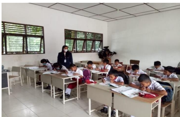
Gambar 8. Anggota tim PkM sedang mengawasi ujian penguasaan bahasa di salah satu ruangan.