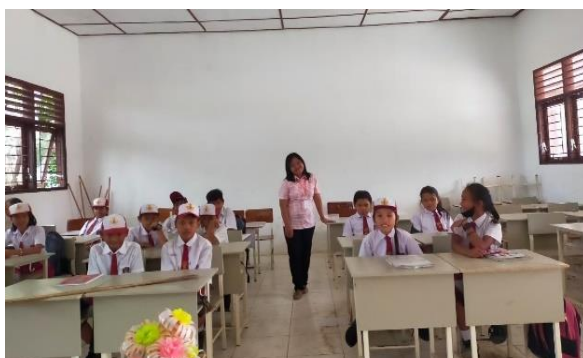
Gambar 4. Salah seorang anggota tim sedang menyuruh peserta didik melihat tulisan abjad ke papan tulis.