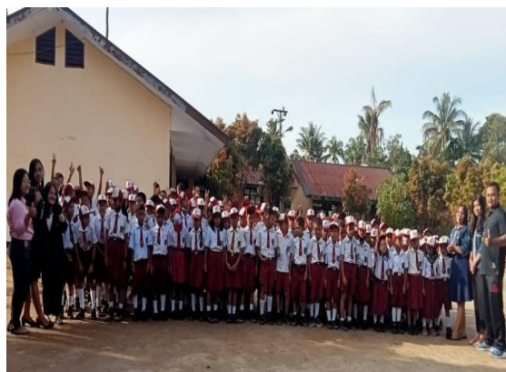
Gambar 3. Peserta didik semangat dengan kehadiran tim PkM.