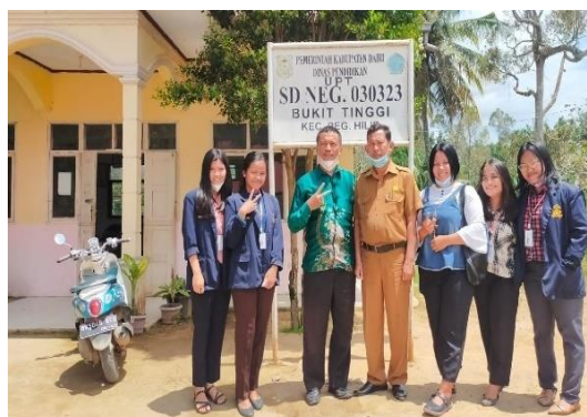
Gambar 9. Tim PkM dengan kepala sekolah berkeliling meninjau lingkungan sekolah terkait dengan