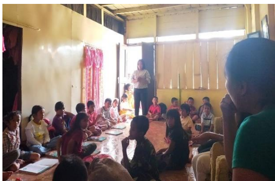
Gambar 6. Tim PkM melaksanakan pembelajaran bahasa indonesia dan bahasa inggris di Posko tempat tinggal.