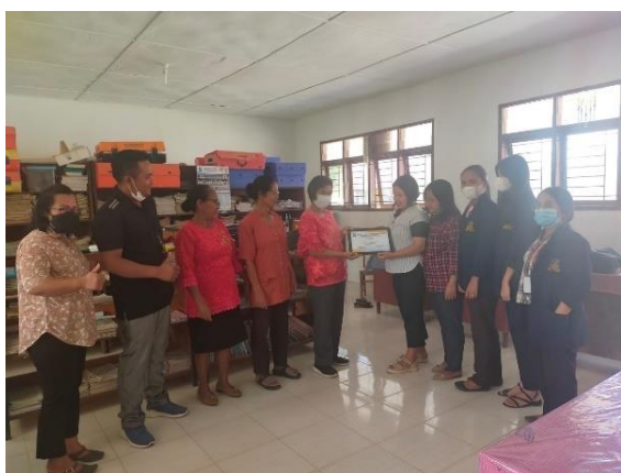
Gambar 10. Tim PkM memberikan kenang-kenangan berupa sertifikat ke sekolah yang diwakili oleh salah seorang guru bidang studi