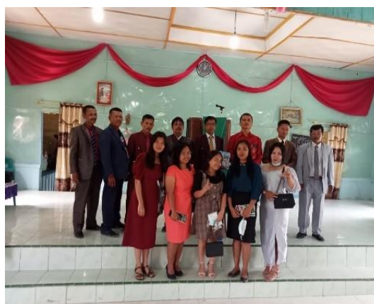
Gambar 11. Tim PkM pamit dengan tokoh masyarakat setelah selesai ibadah di gereja HKBP Bukit Tinggi.

Persentase keberhasilan peserta didik dalam berbahasa setelah diberikan pembimbingan disajikan pada Tabel 3, dan diagram batangnya ditunjukkan pada Gambar 12.