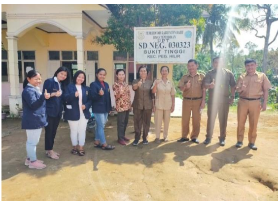
Gambar 2. Guru dan kepala sekolah mengapresiasi kehadiran tim PkM

Program pengabdian kepada masyarakat yang dilaksanakan mulai tanggal 03 s.d 26 Februari 2022 melibatkan dosen sebagai ketua tim dan mahasiswa sebagai anggota dalam upaya meningkatkan penggunaan bahasa indonesia dan bahasa inggris. Mahasiswa yang terlibat terdiri dari program studi pendidikan bahasa indonesia, bahasa inggris dan ekonomi yang dianggap mampu melaksanakan pembelajaran di satuan pendidikan sekolah dasar (SD), dan seluruh hasil kegiatan ditampilkan pada Gambar 2 sampai dengan Gambar 11.