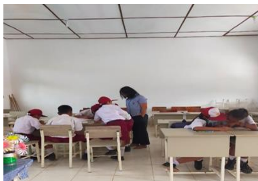
Gambar 7. Salah seorang anggota tim sedang melakukan pembimbingan pada kelompok belajar.