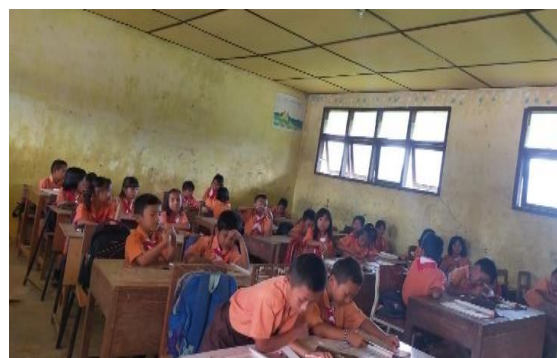
Gambar 5. Peserta didik saling berdiskusi dan berkolaborasi antar sesama teman