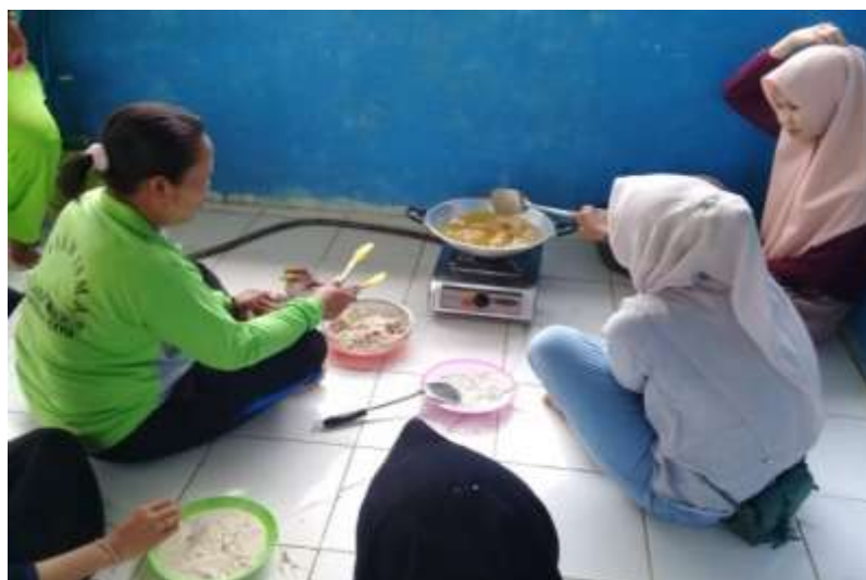
Gambar 3: Pelatihan pembuatan jamur crispy