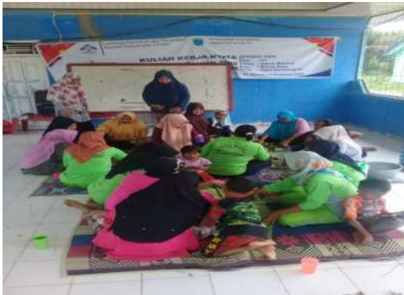
Gambar 2: Pembukaan Pelatihan dan Pendampingan Pengolahan Jamur cispny

Berikut ini dokumentasi selama pelaksanaan pendampingan pembuatan jamur crispy di Desa Dabuk Makmur.