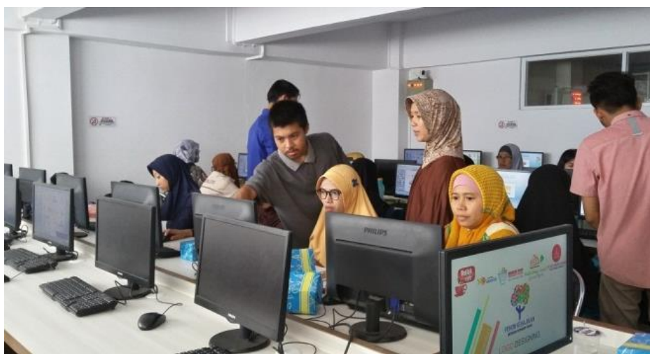
Gambar 3 Sinergi antara Dosen dan Mahasiswa dalam Pelaksanaan Pelatihan