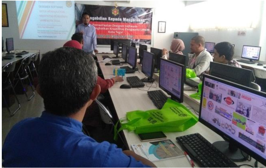
Gambar 1 Pelatihan Hari Pertama