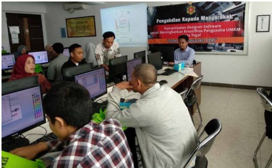
Gambar 2 Pelatihan Hari Kedua