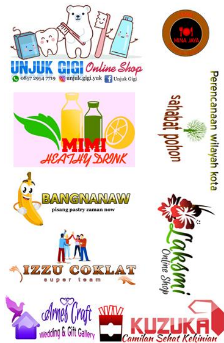
Gambar 4 Hasil Desain Logo dari Para Peserta

Para peserta pada hari pertama dan kedua terdiri dari pengusaha UMKM yang berbeda. Dalam satu hari para peserta ditarget untuk dapat menghasilkan minimal satu desain logo usahanya dan pamflet promosi produknya. Desain logo menggunakan tools AAA Logo. Tools ini sangat mudah dan cepat pengoperasiannya. Sedangkan untuk mendesain pamflet promosi produk menggunakan online tools yaitu Canva. Canva merupakan software untuk desain yang cara pengoperasiannya secara online melalui laman www.canva.com . Karena waktu yang terbatas masih banyak peserta yang belum menyelesaikan desain pamflet produk usahanya. Akan tetapi untuk desain pembuatan logo semua peserta mampu membuatnya.