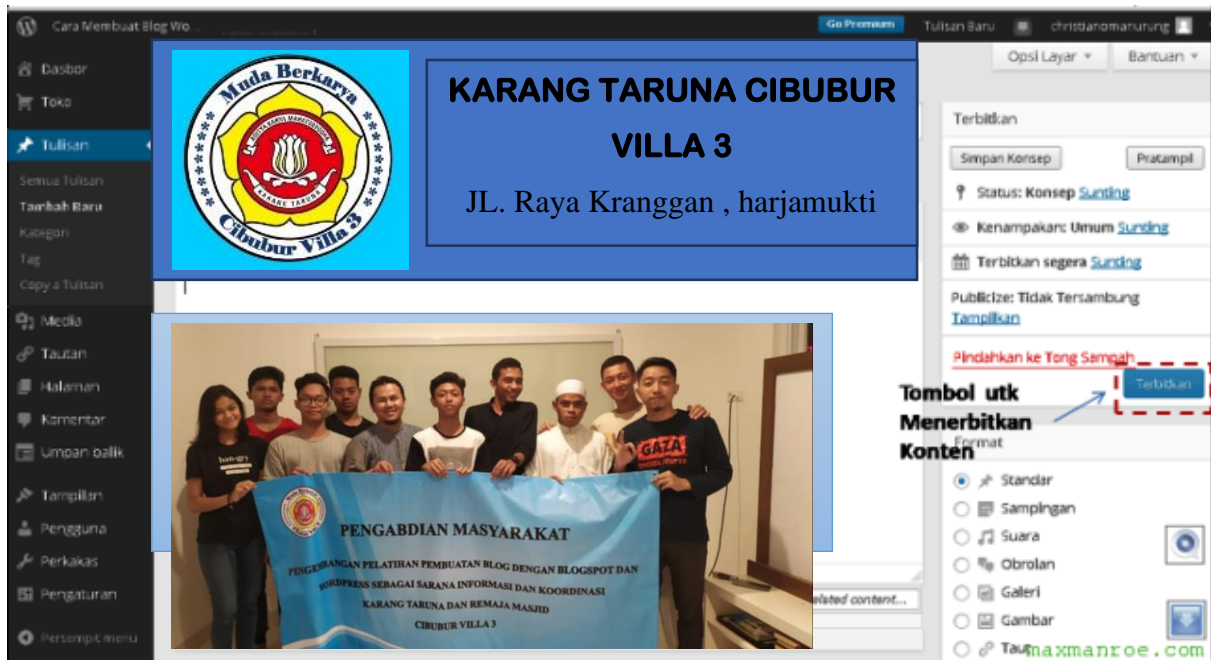
Gambar 3 Hasil blog dengan WordPress