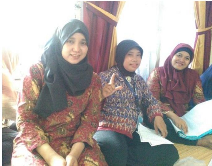
Gambar Tim Abdimas