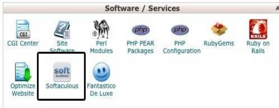
Gambar 3. Softaculous icon

Adapun beberapa materi yang diberikan antara lain :