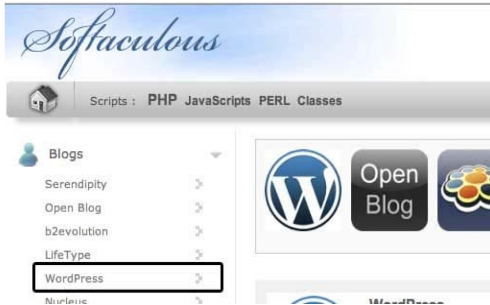
Gambar 4. Softaculous wplink