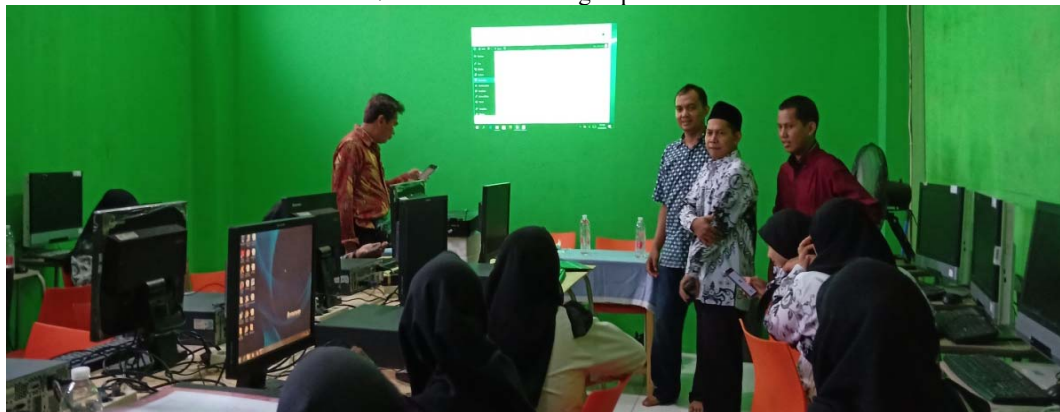
Gambar 8. Foto kegiatan Abdimas