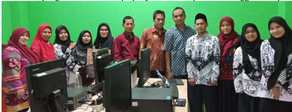
Gambar 7. Foto bersama dengan peserta Abdimas

Berikut adalah beberapa foto kegiatan abdimas yang berlangsung sehari penuh, dari sambutan, pengisian materi berupa penyuluhan dan pelatihan hingga acara penutup.