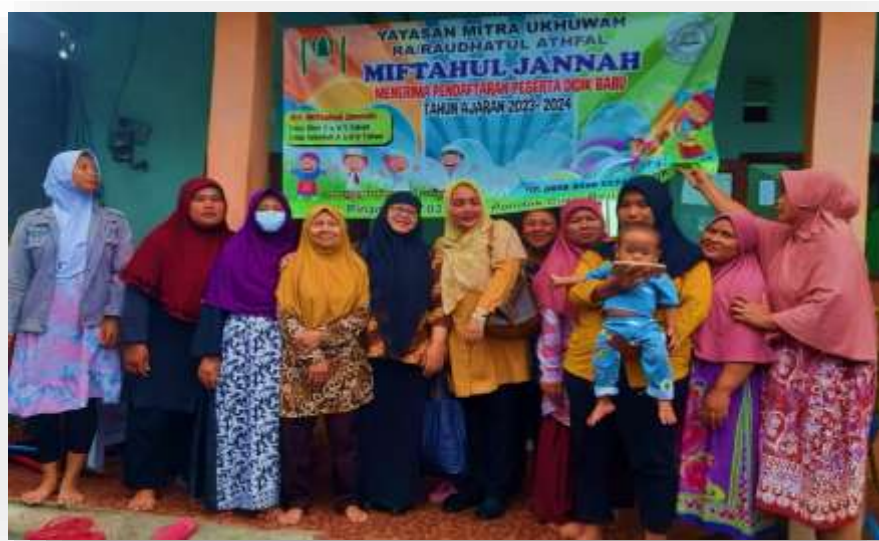
Gambar 1. Foto Bersama Tim dan Mitra

Pada bulan Juni 2024 sampai dengan Juli 2024 telah dilaksanakan PKM ABDIMAS Semester Genap 2023–2024. Hasil akhir dari program ini adalah bagian pembelajaran keterampilan berbicara bahasa Inggris dengan menggunakan teknik realia. Orang tua murid TK Miftahul Jannah dapat memperoleh manfaat dari teknik realia. Berikut ini adalah capaian pendidikan: Dengan menggunakan strategi pendekatan dan praktik bahasa Inggris yang menyenangkan, kegiatan ini dilaksanakan selama lima bulan dalam rangka memberikan pelatihan berbicara bahasa Inggris secara mandiri dan pendampingan. Pelaksanaan pelatihan dimulai pada bulan April 2023 dan berakhir pada bulan Juli.