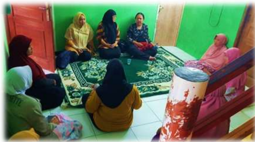
Gambar 2. Kegiatan Pelaksanaan Abdimas

Pada sesi pertama, materi pada tahap pertama ini berfokus pada teori dan metode berbicara bahasa Inggris tanpa takut salah. Baik tulisan maupun gambar digunakan untuk menyajikan daftar kosakata. Daftar kosakata ini dimaksudkan untuk memberikan pemahaman umum kepada siswa tentang mata pelajaran yang akan dibahas di kelas. Selain itu, kumpulan terminologi ini akan membantu orang tua dalam mengajar anak-anak mereka di TK Miftahul Jannah. Strategi pengajaran bahasa yang akan digunakan untuk mengajarkan berbicara bahasa Inggris sesuai dengan topik yang diberikan diberikan oleh tim pengabdian masyarakat pada sesi kedua. Pemahaman tata bahasa ini diperlukan agar siswa dapat menyusun kata menjadi kalimat dengan tata bahasa yang benar.