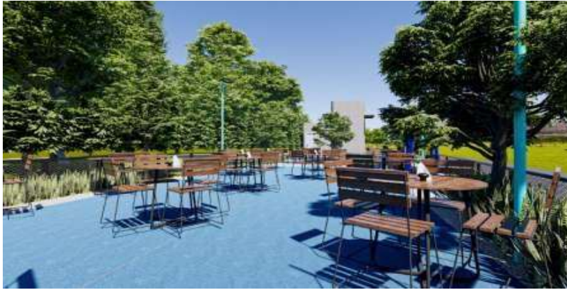
Gambar 9. Visual 3d Lapangan yang Berubah Fungsi

Dalam area ruang komunal ini, meja kursi yang dihadirkan tidak terlalu banyak namun bisa membuat suasana ruang komunal ini senantiasa hidup dengan aktivitas warga setiap harinya. Bentukan meja kursi seperti ini juga dimungkinkan jika sesuatu saat dibutuhkan berubah layout meja dan kursinya karena memungkinkan untuk digeser-geser.