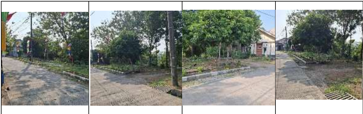
Gambar 2. Kondisi Lahan Lokasi PkM