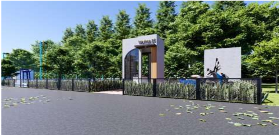
Gambar 7. Visual 3d Gerbang Ruang Komunal

Pada gerbang digunakan bentuk dasar seperti kotak dan setengah lingkaran supaya bentuk yang dihadirkan tidak terlalu rumit, dan tidak membutuhkan waktu lama dalam pembangunan. Bentuk-bentuk sederhana ini pun diharapkan bisa menghemat biaya namun tetap memberikan kesan estetis karena perpaduan tekstur pada permukaan dinding dan cat yang digunakan. Penggunaan tanaman sebagai pagar hidup pun memiliki berbagai tujuan, seperti pencegahan binatang berbahaya secara alami, seperti ular dan serangga-serangga lainnya. Lalu juga dimaksudkan agar biaya untuk pembuatan pagar bisa diminimalisir. Selain itu bisa menambah penghijauan yang ada di lingkungan RT.05 ini sehingga ruang komunal ini bisa semakin asri.