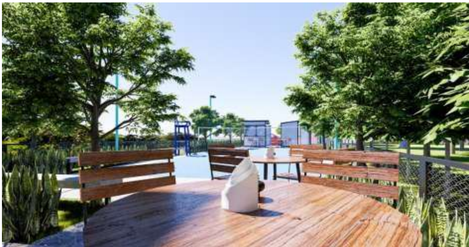
Gambar 8. Visual 3d Area Duduk-duduk

Pada area dalam ruang komunal disiapkan juga area duduk-duduk serta olahraga, karena dari rutinitas para warga yang sering berkumpul khususnya ibu-ibu dan bapak-bapak sambil berolahraga bersama. Area berkumpul ini dibuat lengkap dengan kursi dan terdapat mejanya. Sehingga kami sebagai tim pelaksana PkM menghadirkan meja dan kursi ini sebagai salah satu elemen penting dalam desain ruang komunal ini. Meja dan kursi ini pun sifatnya bukan permanen sehingga bisa dipindah saat sedang dibutuhkan ruang yang cukup luas untuk acara tertentu.