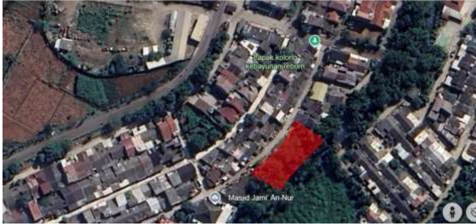
Gambar 1. Lokasi Pengabdian kepada Masyarakat

Dari penjelasan di atas dibutuhkan ruang komunal dengan berbagai fungsi yang bisa digunakan oleh seluruh warga. Ruang komunal bisa difungsikan sebagai tempat bermain misal bermain bola, petak umpet, atau untuk sarana olahraga seperti lapangan bulutangkis, voli, juga untuk senam dan arisan ibu-ibu dan tempat berkumpul bapak-bapak saat malam hari juga akhir minggu.