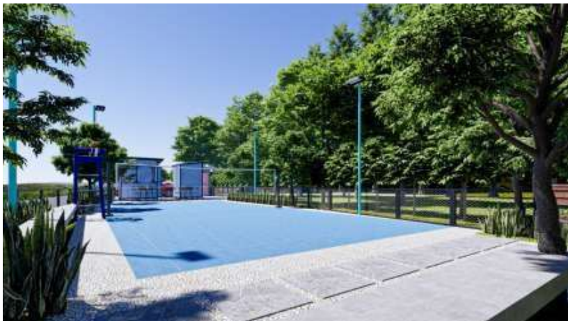
Gambar 7. Visual 3d Lapangan Olahraga di Siang Hari

Dalam area ruang komunal ini, meja kursi yang dihadirkan tidak terlalu banyak namun bisa membuat suasana ruang komunal ini senantiasa hidup dengan aktivitas warga setiap harinya. Bentukan meja kursi seperti ini juga dimungkinkan jika sesuatu saat dibutuhkan berubah layout meja dan kursinya karena memungkinkan untuk digeser-geser.