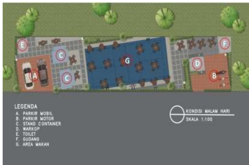
Gambar 6. Visual Siteplan Ruang Komunal Kondisi Malam Hari

Pada malam hari, saat lapangan tidak digunakan sebagai area olahraga, lapangan ini bisa berubah fungsi menjadi area duduk-duduk juga karena meja dan kursinya bersifat temporer sehingga bisa dipindahkan jika tidak dibutuhkan atau lapangannya digunakan untuk kebutuhan yang lain, misal olahraga, atau ada kegiatan bersama lainnya yang membutuhkan ruang dalam ukuran dan kapasitas besar.