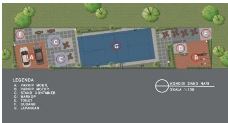
Gambar 4. Visual Siteplan Ruang Komunal Kondisi Siang Hari

Ruang komunal ini pun dilengkapi dengan jogging track kecil paling tidak bisa digunakan untuk berjalan-jalan, dengan memanfaatkan stepping stone dan split tabur. Selain itu area hijaunya dipenuhi dengan tanaman lidah mertua agar perawatannya tidak sulit dan membutuhkan perhatian khusus serta biaya besar. Selain itu tanaman lidah mertua juga berguna untuk menghalangi dari gangguan hewan-hewan berbahaya seperti ular, mengingat lokasi ruang komunal ini di samping sungai.