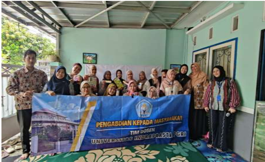
Gambar 3. Evaluasi kegiatan pengabdian masyarakat bersama mitra

bertujuan untuk mendapatkan umpan balik dari peserta mengenai pelaksanaan kegiatan, mulai dari penyampaian materi, metode penyampain hingga manfaat yang dirasakan. Peserta terlihat antusias memberikan saran dan masukan untuk perbaikan kegiatan di masa depan. Setelah sesi evaluasi, tim pengabdian masyarakat memberikan hadiah kepada peserta yang aktif selama kegiatan. Hadiah diberikan sebagai bentuk apresiasi atas partisipasi dan kontribusi mereka dalam diskusi. Momen tersebut menjadi penutup yang bermakna dan menyenangkan seluruh pihak yang terlibat.