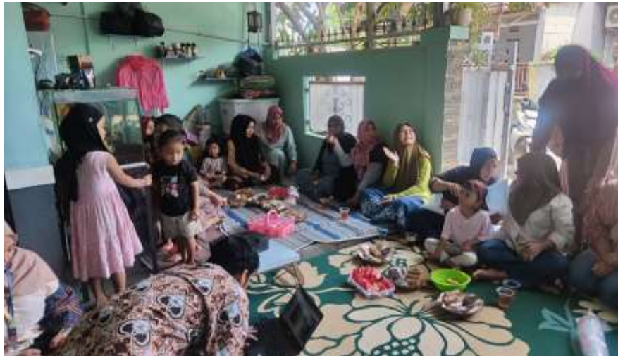
Gambar 1. Mitra dan tim pengabdian masyarakat dari Universitas Indraprasta PGRI mempersiapkan kegiatan