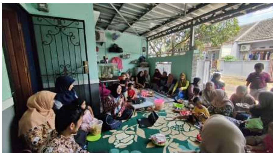
Gambar 2. Pelaksanaan kegiatan pengabdian masyarakat dari Universitas Indraprasta PGRI

Pada tahapan ini berisikan layanan informasi kepada peserta. Kemudian peserta dapat bertanya langsung tentang masalah yang peserta hadapi dan mendapatkan solusi dari tim pengabdian masyarakat. Layanan ini merupakan salah satu upaya untuk mencegah perselingkuhan dengan memberikan dukungan informasi yang tepat. Kegiatan ini bertujuan untuk meningkatkan kesadaran peserta tentang pentingnya menjaga keharmonisan hubungan dan mencegah perselingkuhan melalui edukasi dan layanan informasi yang konferensif. Melalui kegiatan ini harapannya dapat memberikan pemahaman kepada masyarakat tentang dampak negatif perselingkuhan, baik secara psikologis, sosial maupun ekonomi. Selain itu, tim pengabdian masyarakat juga memberikan solusi praktis dan dukungan informasi untuk mencegah terjadinya perselingkuhan dalam rumah tangga.