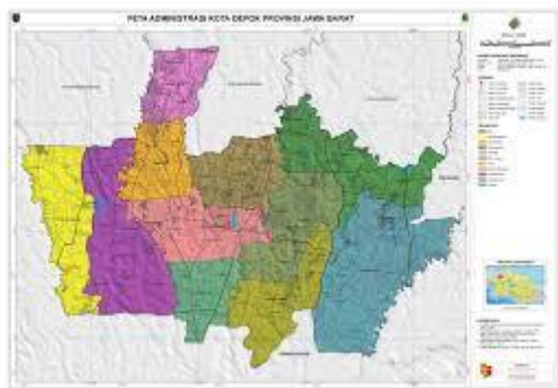
Gambar 1.1 Peta Kota Depok

Kelurahan Bedahan adalah salah satu kelurahan yang ada di Kecamatan Sawangan Kota Depok. Kelurahan Bedahan terletak pada : sebelah Utara berbatasan dengan kelurahan Sawangan Baru, sebelah Selatan berbatasan dengan desa Raga Jaya kecamatan Bojong Gede, sebelah Barat berbatasan dengan kelurahan Pengasinan kecamatan Sawangan, sebelah Timur berbatasan dengan kelurahan Pasir Putih kecamatan Sawangan.