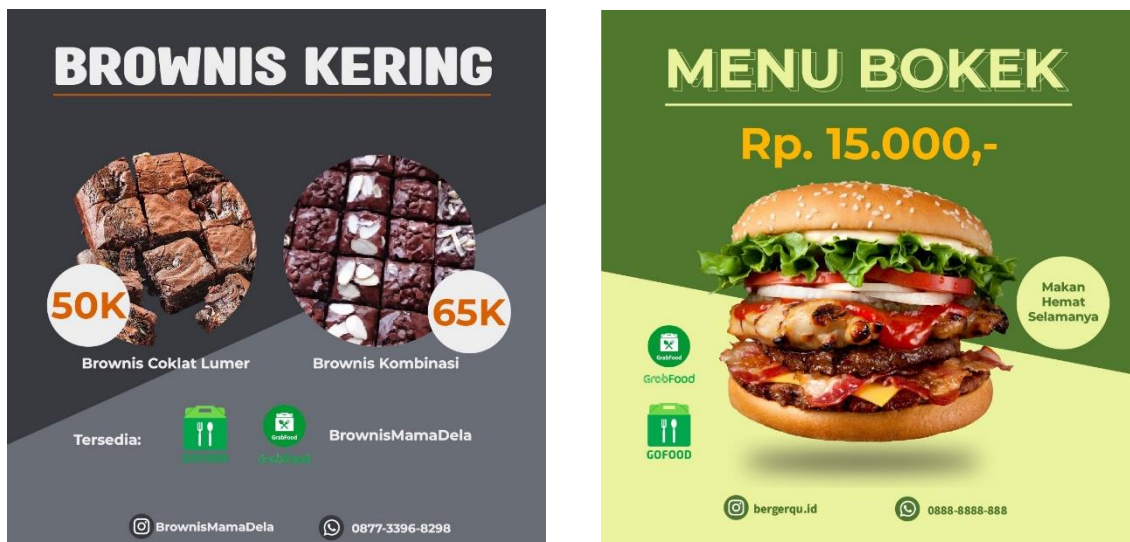
Gambar 4. Hasil Pelatihan Peserta dalam Penggunaan Aplikasi Canva

Kegiatan ini membahas tentang bagaimana cara menggunakan aplikasi Canva untuk perancangan pemasaran usaha. Membuat perancangan pemasaran usaha dengan menggunakan aplikasi Canva dapat dilakukan dengan mudah karena terdapat jumlah template yang cukup banyak dan gratis yang dapat digunakan oleh peserta. Berikut adalah hasil pembuatan poster dari peserta pelatihan. Dimana peserta sudah mulai mahir untuk dapat menggunakan aplikasi Canva dengan sangat baik.