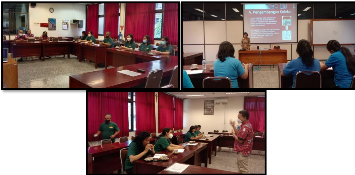
Gambar 2. Pelatihan Literasi Perpustakaan

masing dengan bimbingan fasilitator. Setelah berhasil mengunduh aplikasi SLIMS, para guru diberi pelatihan mengenai cara memasukkan data bibliografi, pembuatan label dan barcode , input nama anggota, mencatat peminjaman, pengembalian, perpanjangan, serta pencatatan jumlah pengunjung perpustakaan. Setelah mengikuti pelatihan literasi perpustakaan, para guru memiliki kemampuan untuk menerapkan aplikasi SLIMS dalam pengelolaan perpustakaan di sekolah. Pelibatan guru secara langsung dalam pelatihan literasi perpustakaan ini sesuai dengan standar The American Association of School Librarians (AASL) yang menyampaikan bahwa terdapat lima landasan dalam pelatihan perpustakaan, yakni bertanya, mengikutsertakan, kolaborasi, eksplorasi, dan melibatkan yang diharapkan akan membawa inovasi dalam pengelolaan perpustakaan di masa mendatang (Burns & Dawkins, 2021). Evaluasi kemampuan literasi perpustakaan para guru SD Kanisius Sorowajan Yogyakarta diukur pada hari ke-11 melalui posttest . Di bawah ini terdapat beberapa dokumentasi dari pelaksanaan kegiatan pelatihan literasi perpustakaan.