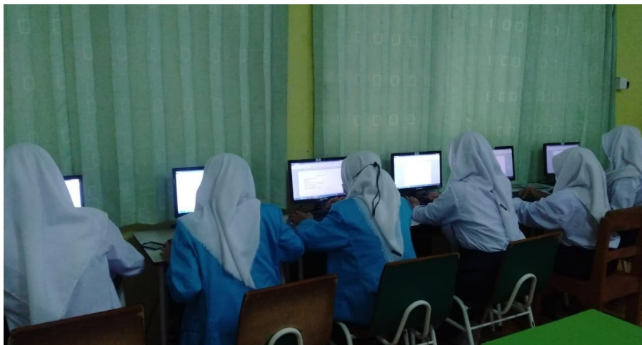
Gambar 3. Pelaksanaan kegiatan pengabdian