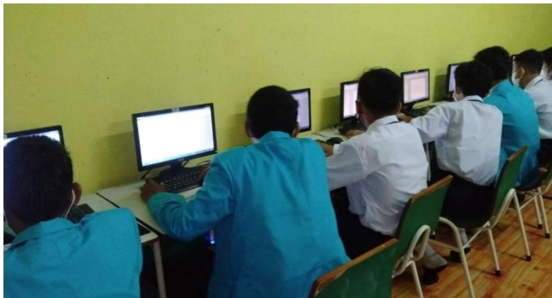
Gambar 2. Pelaksanaan kegiatan pengabdian

Hasil dari kegiatan sosialisasi ini adalah menambah ilmu dan wawasan siswa-siswi MTS Assyafi'iyah 04 dalam menggunakan aplikasi Microsoft Word. Berdasarkan hasil pelatihan diperoleh bahwa penguasaan pengoperasian Microsoft Word pada siswa-siswi MTS Assyafi'iyah 04 Cipayung Jakarta Timur berjalan efektif.