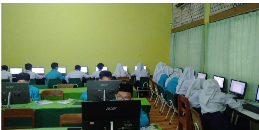
Gambar 4. Pelaksanaan kegiatan pengabdian