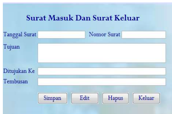
Gambar 3. Tampilan Surat Masuk dan Surat Keluar