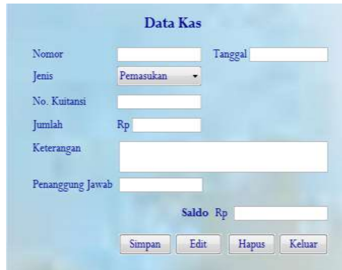
Gambar 3. Tampilan Data Kas