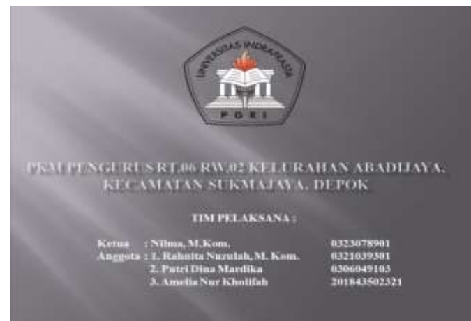
Gambar 5. Materi Abdimas

Berikut adalah link kegiatan pengabdian kepada masyarakat melalui media Google Meet: https://meet.google.com/nbf-sask-occ .