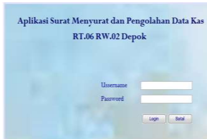
Gambar 2. Tampilan Login

Dengan menggunakan aplikasi Zoom tim pengabdian kepada masyarakat melakukan sosialisasi dan pelatihan penggunaan Aplikasi Surat Menyurat dan Pengolahan Data Kas. Beberapa kegiatan ini terdokumentasi dengan baik melalui tangkapan layar dan dilakukan recording . Bukti ini sebagai otentik untuk dapat melengkapi laporan kegiatan pengabdian kepada masyarakat.