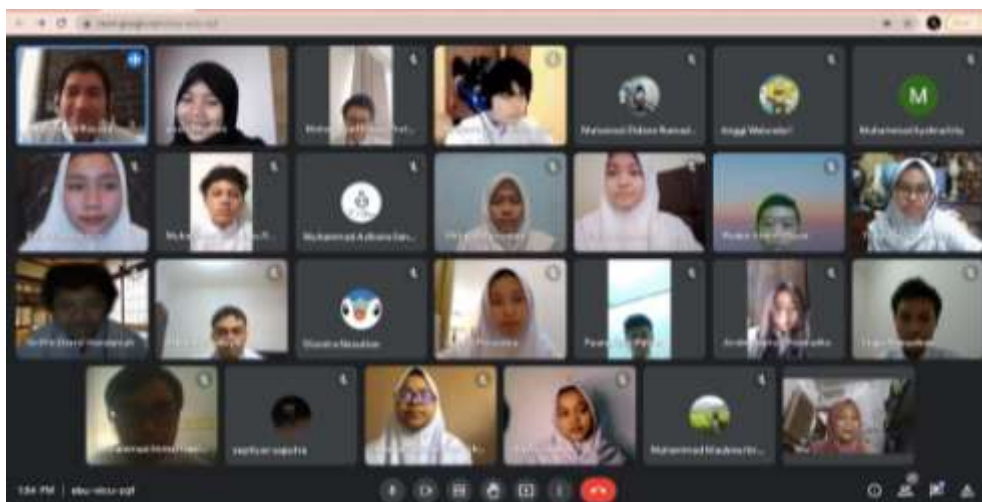
Gambar 2. Kegiatan pelatihan

tim juga melakukan diskusi dengan siswa terkait simulasi praktikum virtual. Setelah kegiatan ini dilakukan tim memberikan angket yang berisi respon siswa terkait mengikuti kegiatan physics virtual experiment. Dari hasil angket yang disebar ke siswa melalui google form, dieproleh 80 % peningkatan dan pemahaman siswa mengenai praktikum virtual, dan 100 % ssiwa menyukai dan merespon kegiaiatan ini secara positif.