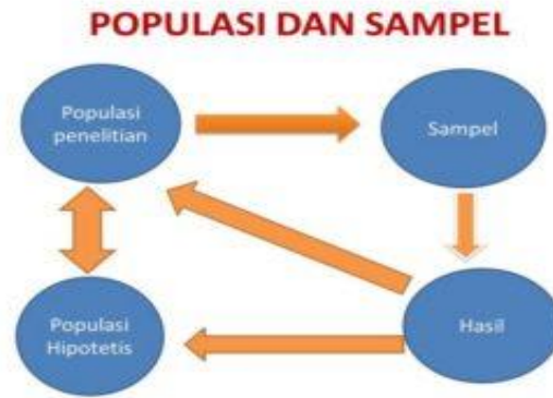
Gambar 1. Populasi dan Sampel

Nilai yang dihitung dan diperoleh dari populasi ini disebut dengan parameter. Populasi merupakan seluruh jumlah dari subjek yang akan diteliti oleh seorang peneliti. Menurut Arikunto Suharsimi (1998: 117), Populasi adalah keseluruhan objek penelitian. Apabila seseorang ingin meneliti sebuah elemen yang ada dalam wilayah penelitian tersebut, maka penelitiannya merupakan penelitian populasi. Adapun untuk sampel adalah bagian dari populasi yang memiliki karakteristik mirip dengan populasi itu sendiri. Arikunto (2006: 131), Sampel adalah sebagian atau sebagai wakil populasi yang akan diteliti. Jika penelitian yang dilakukan sebagian dari populasi maka bisa dikatakan bahwa penelitian tersebut adalah penelitian sampel. Sugiyono (2008: 118), sampel adalah suatu bagian dari keseluruhan serta karakteristik yang dimiliki oleh sebuah populasi.