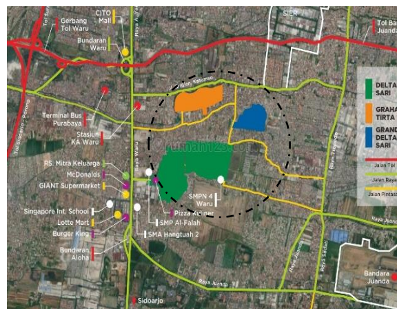
Gambar 2. Lokasi kawasan pemukiman di Deltasari Sidoarjo, termasuk dalam penelitian tahap metodologis pertama

Aspek spasial, demografi, dan sosial ekonomi dipertimbangkan karena ketiganya berkaitan erat dengan gaya hidup, yang dapat bermanfaat atau merugikan kesehatan secara umum. Indikator utama kualitas lingkungan perkotaan pada tingkat lingkungan terkait dengan kepadatan hunian, keragaman penggunaan lahan, aksesibilitas pelayanan, kesempatan berjalan kaki dan bersepeda, ruang terbuka hijau perkotaan, ruang aman untuk bermain anak, untuk duduk dan bersosialisasi. Kriteria demografi meliputi struktur umur penduduk, sedangkan kriteria sosial ekonomi adalah status pekerjaan dan tingkat pendidikan. Setiap kriteria dialokasikan satu set indikator, dievaluasi secara individual untuk setiap area perumahan dengan mengacu pada nilai yang ditentukan atau yang direkomendasikan. Deskripsi ini digunakan untuk perbandingan antara daerah yang lebih tua dan yang lebih baru, dan untuk pemilihan daerah untuk studi lebih lanjut. Karena fokus penelitian adalah kompleks perumahan baru, kami memasukkan keempatnya ke dalam studi lebih lanjut.