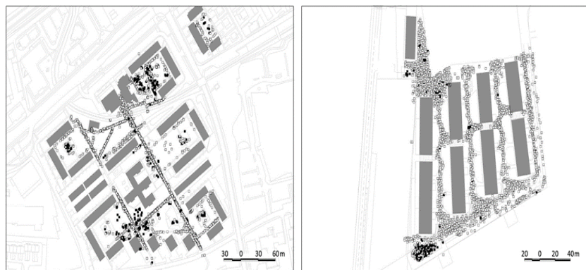
Gambar 5. Penyajian grafik hasil tidak sepenuhnya mengungkapkan semua ragam permainan anak-anak di Deltasari.

Anak-anak yang aktif terdistribusi secara merata di seluruh area terbuka dengan sebagian besar kegiatan bermain anak-anak yang diamati di luar taman bermain, terutama di daerah dengan fitur lanskap yang beragam seperti tepi antara ruang terbuka dan tata ruang luar yang bervariasi. Program yang buruk dan kurangnya area terbuka menyebabkan berkurangnya variasi penggunaan ruang. Secara konseptual, sebuah kegiatan dapat terdiri dari sub-sub kegiatan yang saling berhubungan sehingga terbentuk sistem kegiatan (Rapoport, 1986).