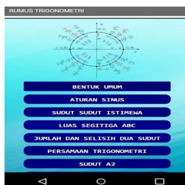
Gambar 3: Tampilan menu

Tampilan Gambar 2. terlihat sekilas materi tentang trigonometri. Sedikit penjelasan tentang trigonometri dan kegunaan trigonometri. Dan tersaji gambar salah satu contoh penggunaan trigonometri dalam penyelesaian lingkaran.