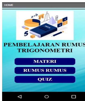
Gambar 1. Tampilan Menu Home

Tahapan ini tim peneliti melakukan beberapa desain atau merancang tampilan layer berdasarkan tahapan analisis permasalahan yang dihadapi oleh guru dan siswa dalam mempelajari materi trigonometri. Tim melakukan desain aplikasi tampilan layer tentang rumus-rumus terkait pembelajaran trigonometri. Terdapat beberapa desain tampilan layar yang peneliti desain pada aplikasi yang akan dibuat dengan beberapa pertimbangan seperti materi rumus yang digunakan/diperlukan untuk siswa SMP dan SMA karena target dari pada calon pengguna aplikasi pembelajaran ini adalah siswa SMP dan SMA. Berikut beberapa tampilan layar yang didesain oleh tim peneliti tersaji dalam Gambar 1., Gambar 2., Gambar 3., Gambar 4., dan Gambar 5.