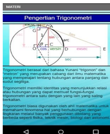
Gambar 2. Tampilan Pengertian Trigonometri

Pada Gambar 1. terlihat tampilan awal bagian depan “home” yang ketika mengunduh aplikasi dan melakukan pembukaan aplikasi pertama kali akan muncul menu home . Di menu home ada beberapa petunjuk atau tombol yang digunakan untuk melanjutkan lebih dalam ke dalam aplikasi yaitu materi, rumus dan quiz . Untuk materi dan soal yang disajikan nantinya secara umum saja yang memang dipelajari pada saat SMP dan SMA.