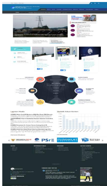
Gambar 3. Tampilan Sebelum

Tampilan Laman web sebelum dan sesudah perbaikan :