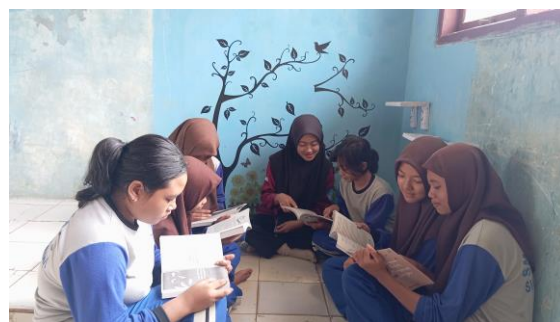
Gambar 4. Mahasiswa Kampus Mengajar Menginisiasi Pojok Baca

Program Kampus Mengajar memberikan fasilitas yang lengkap bagi peserta didik agar dapat belajar dengan lebih menyenangkan. Selain ruang baca dan media pembelajaran, program ini juga membantu peserta didik dalam mengadaptasi teknologi dan administrasi sekolah. Peserta didik terlihat sangat antusias mengikuti kegiatan ini dan terdorong untuk menjadi lebih aktif. Namun, terdapat beberapa tantangan dalam pelaksanaan Program Kampus Mengajar angkatan 5, seperti masalah koordinasi, keterbatasan sumber daya, dan jadwal yang padat. Untuk mengatasi tantangan ini, diperlukan kerja sama dan perencanaan yang matang guna memastikan kesinambungan dan keberhasilan program ini di masa depan. Dengan demikian, Program Kampus Mengajar memiliki potensi untuk terus berkembang dan memberikan dampak positif yang lebih besar dalam meningkatkan mutu pendidikan, khususnya di tingkat dasar [19].