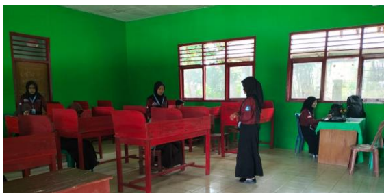
Gambar 3. Mahasiswa Kampus Mengajar Mendampingi Guru Pengembangan Kompetensi IT

Implementasi program Kampus Mengajar tidak hanya memberikan dampak positif terhadap keterampilan peserta didik, tetapi juga memberikan bantuan kepada guru dalam hal administrasi terkait peningkatan literasi dan numerasi. Program Kampus Mengajar (KM) merupakan program pendampingan pengajaran yang bertujuan untuk meningkatkan mutu pembelajaran di daerah terpencil dan sulit dijangkau dengan melibatkan mahasiswa. Mahasiswa yang terlibat dalam program ini memberikan bimbingan kepada guru dalam proses pembelajaran [14].