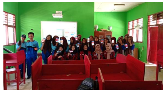
Gambar 2. Mahasiswa Kampus Mengajar Melaksanakan AKM dengan Gawai/HP

meningkatkan kualitas dan relevansi pendidikan; 3) membantu mengatasi kekurangan tenaga pendidik yang berkualitas di daerah yang membutuhkan bantuan tersebut [11]. Pelaksanaan program Kampus Mengajar dilakukan dengan mengirimkan mahasiswa untuk berkontribusi di satuan pendidikan yang mereka tempati, dengan fokus pada tiga aspek pelaksanaan, yaitu (1) transfer pengetahuan, mahasiswa akan melakukan transfer pengetahuan atau membantu proses pembelajaran; (2) membantu manajemen sekolah atau administrasi guru, mahasiswa akan membantu guru dalam pengolahan data sekolah; dan (3) adaptasi teknologi, mahasiswa Kampus Mengajar akan mengenalkan teknologi kepada peserta didik dan guru serta melatih peserta didik dalam menggunakan tablet/smartphone untuk latihan Asesmen Kompetensi Minimum (AKM) [12].