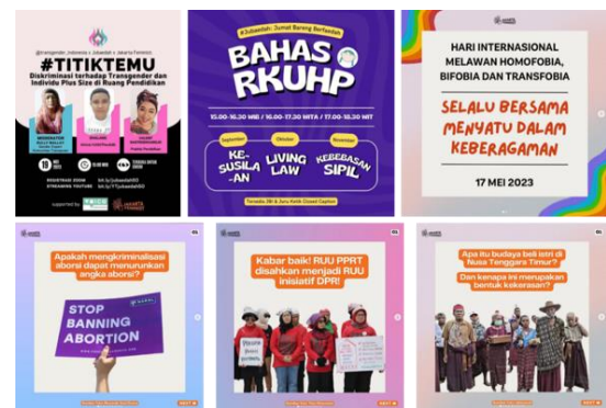
Gambar 3: Beragamnya post JakartaFeminist terkait sejumlah isu

Gerakan kesetaraan gender di Indonesia yang dilakukan oleh @jakartafeminist mencakup berbagai masalah dan melibatkan individu dari berbagai kelas sosial, latar belakang, dan identitas. Beragam isu menjadi perhatian dari Jakarta Feminist melalui akun instagramnya, seperti kesetaraan gender, kebijakan dan regulasi yang menyangkut hak-hak perempuan, kekerasan terhadap perempuan, hak-hak reproduksi, diskriminasi di tempat kerja, serta norma dan praktik budaya yang melanggengkan ketidaksetaraan gender. Bahkan, isu mengenai keadilan bagi komunitas LBGTQ+ juga menjadi perhatian mereka akhir-akhir ini. Sejumlah wacana dan isu tersebut nyaris tidak terangkat pada media mainstream di Indonesia. Konten yang kemudian diunggah @jakartafeminist menjadi pemicu kesadaran kolektif dan pengetahuan akan hal tersebut. Masalah-masalah tersebut berdampak secara langsung maupun tidak langsung pada perempuan dari berbagai kelas sosial, etnis, agama, dan wilayah di Indonesia.