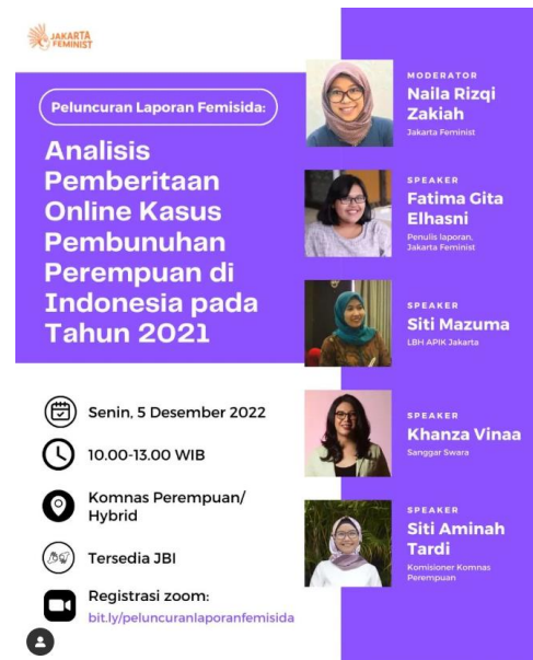
Gambar 1. Posting JakartaFeminist terkait kegiatan penelitian

Kegiatan lain yang dilakukan Jakarta Feminist adalah diseminasi penelitian dan pendokumentasian kegiatan. Salah satu kegiatan penelitian yang dilakukan oleh Jakarta Feminist adalah terkait Femisida yang dilakukan pada tahun 2021. Dalam penelitian tersebut juga menganalisis framing liputan media tentang kasus pembunuhan terhadap perempuan di Indonesia. Selain melakukan penelitian, mereka juga mendukung kegiatan penelitian yang dilakukan oleh aktivis lainnya. Salah satunya adalah dukungan terhadap riset yang menyangkut praktik kekerasan dan pelecehan di dunia kerja. Penelitian tersebut dilakukan oleh Konde.co dan Voice yang sama-sama bergerak dalam isu gender.