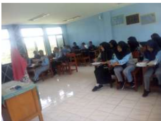
Gambar 1: Suasana Kegiatan Pembelajaran

Kegiatan pembelajaran yang dilakukan oleh guru di kelas dalam mengasah kemampuan siswa untuk menulis anekdot merupakan salah satu nya diterapkan dengan metode pembelajaran genius learning. Hal ini telah diteliti sebelumnya dapat meningkatkan kemampuan siswa dalam menulis anekdot dalam pembelajaran bahasa Indonesia.