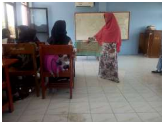
Gambar 2: Guru Sedang Memberikan Arahan

Kegiatan pembelajaran yang dilakukan di kelas menunjang untuk mengasah keterampilan bagaimana siswa dapat mengaplikasikan anekdot dan menuliskannya sehingga dapat menjadi salah satu indikator keberhasilan pembelajaran yang dilakukan di kelas.