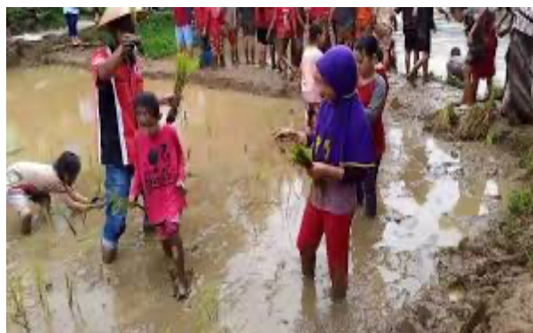
Gambar 3. Penguatan Tradisi di SD Islam Al-Isro

Pengimplementasian nilai akomodatif terhadap budaya lokal di sekolah memiliki dampak terhadap penguatan dan pengembangan tradisi setempat. Karena diwariskan kepada generasi penerus melalui proses pendidikan dengan pendekatan pedagogi yang lebih sistematis dan dikembangkan sesuai dengan tuntutan zaman ([13], [14]).