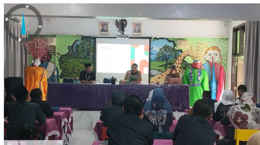
Gambar 1. Pembinaan Sekolah Sekaligus Sosialisasi Anti Kekerasan SD Islam Al-Isro

Sosialisasi yang diadakan oleh SD Islam Al-Isro merupakan salah satu cara untuk dapat memberitahukan informasi pada warga sekolah. Karena pada kegiatan sosialisasi akan lebih fokus membahas berbagai permasalahan yang spesifik dan bagaimana cara mengatasi permasalahan yang sedang terjadi [11].