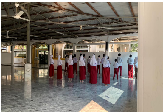
Gambar 2. Kegiatan Pembinaan Ibadah Sejak Dini di SD Islam Al-Isro

Pada kehidupan sehari-hari sikap toleransi bisa dirasakan oleh banyak orang. Toleransi dapat dirasakan secara pribadi, oleh individu lain, maupun oleh masyarakat dan negara secara keseluruhan [12]. Dan dari toleransi menimbulkan rasa aman dan nyaman dalam kehidupan sehari-hari.