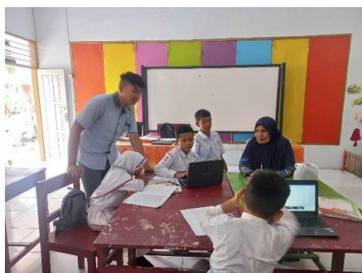
Gambar 4. Kegiatan Pembelajaran Siklus II