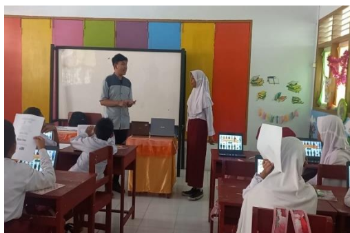
Gambar 2. Kegiatan Pembelajaran Siklus I

Pada pertemuan kedua, tahapan – tahapannya sama seperti pertemuan 1, meneliti tingkat kesiapan peserta didik, mengecek kehadiran, penguasaan kelas lebih ditingkatkan agar pembelajaran berlangsung lebih optimal, melakukan apersepsi dengan mengulang kesimpulan pada pertemuan sebelumnya. Pada pertemuan kedua ini, dilakukan tes evaluasi untuk memperoleh hasil belajar siklus I yang nantinya akan dijadikan bahan analisis dan refleksi.