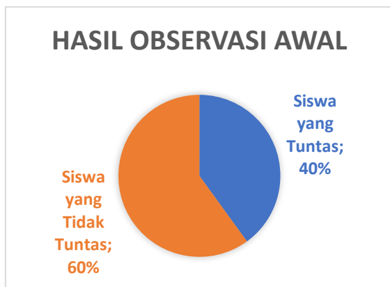
Gambar 1. Persentase Hasil Belajar pada Observasi Awal