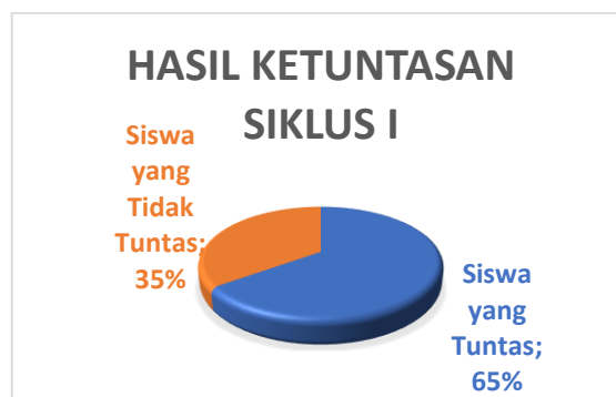
Gambar 3. Hasil Belajar Siklus I

Sesuai hasil penelitian yang telah dilakukan oleh peneliti selama pembelajaran pada siklus I, nilai terendah yang diperoleh siswa adalah 45, sedangkan nilai tertingginya adalah 90. Jumlah siswa yang mencapai KKM (75) adalah 13 orang atau 65%, sedangkan siswa yang belum mencapai KKM berjumlah 7 orang atau 35%.