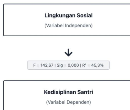
Gambar 2. Pengaruh Parsial Lingkungan Sosial dan Pembiasaan

Hasil penelitian menunjukkan bahwa lingkungan sosial memiliki pengaruh yang sangat signifikan terhadap tingkat kedisiplinan santri di Pondok Pesantren Bidayatul Hidayah Rokan Hilir. Temuan ini didasarkan pada analisis statistik menggunakan One Way ANOVA yang menghasilkan nilai signifikansi sebesar 0,000, jauh di bawah batas probabilitas yang ditetapkan yaitu 0,05. Nilai signifikansi yang sangat kecil ini mengindikasikan bahwa perbedaan tingkat kedisiplinan santri yang diamati berdasarkan kategori lingkungan sosial bukan merupakan hasil dari kebetulan semata, melainkan merupakan perbedaan yang nyata dan dapat dipertanggungjawabkan secara statistik. Lebih lanjut, nilai Fhitung yang diperoleh mencapai 399,541, sebuah angka yang sangat tinggi dan menunjukkan bahwa variasi tingkat kedisiplinan antar kelompok lingkungan sosial jauh lebih besar dibandingkan dengan variasi yang terjadi di dalam masing-masing kelompok. Ketika nilai Fhitung ini dibandingkan dengan Ftabel yang besarnya 3,87, terlihat jelas bahwa Fhitung jauh melampaui Ftabel, yang semakin memperkuat kesimpulan bahwa lingkungan sosial merupakan faktor yang sangat berpengaruh terhadap kedisiplinan santri.