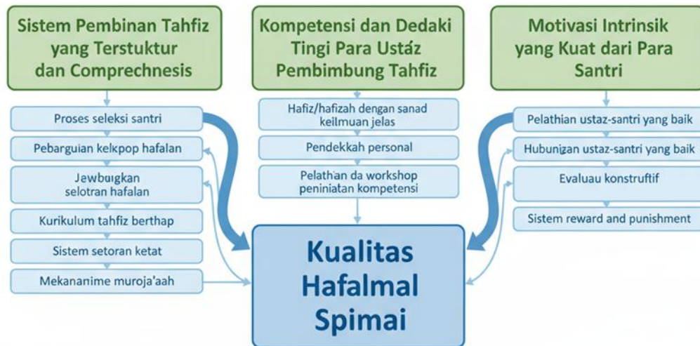
Gambar 3. Faktor-Faktor yang Berkontribusi

Kurikulum tahfiz yang diterapkan pesantren dirancang secara bertahap dan progresif, dimana santri tidak langsung ditargetkan untuk menghafal dalam jumlah banyak tetapi dimulai dari membangun fondasi kualitas hafalan terlebih dahulu. Pada tahun pertama, fokus utama adalah memastikan setiap santri menguasai tajwid dengan sempurna dan mampu menghafal dengan kualitas bacaan yang baik, baru kemudian secara bertahap target kuantitas hafalan ditingkatkan. Sistem setoran hafalan juga sangat ketat dimana ustaz pembimbing tidak akan menerima setoran hafalan baru jika hafalan sebelumnya belum benar-benar lancar dan sesuai kaidah tajwid. Proses ini memastikan bahwa setiap ayat yang dihafal santri benar-benar dikuasai dengan kualitas maksimal sebelum melanjutkan ke ayat berikutnya. Mekanisme muroja'ah diintegrasikan dalam sistem kurikulum dimana setiap hari santri diwajibkan tidak hanya menyetorkan hafalan baru tetapi juga mengulang hafalan lama dengan proporsi waktu yang seimbang, bahkan pada level santri senior proporsi muroja'ah lebih besar dibandingkan menambah hafalan baru untuk memastikan hafalan yang telah dikuasai tetap terjaga kualitasnya.