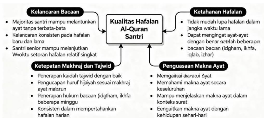
Gambar 2. Kualitas Hafalan Al-Quran Santri

Kualitas hafalan Al-Quran santri di Pondok Pesantren As-Salam Naga Beralih menunjukkan capaian yang sangat baik ditinjau dari tiga aspek utama yaitu kelancaran bacaan, ketepatan makhraj dan tajwid, serta konsistensi dalam menjaga hafalan. Dari aspek kelancaran bacaan, hasil observasi terhadap proses setoran hafalan santri menunjukkan bahwa mayoritas santri mampu melantunkan ayat-ayat Al-Quran yang telah dihafal dengan sangat lancar tanpa terbata-bata atau mengalami kesulitan dalam mengingat kelanjutan ayat. Kelancaran ini terlihat baik pada hafalan baru yang baru saja disetor maupun pada hafalan lama yang telah dikuasai beberapa bulan sebelumnya. Santri-santri senior yang telah menghafal lebih dari sepuluh juz bahkan mampu melanjutkan bacaan dari ayat manapun yang diminta oleh ustaz pembimbing dengan tingkat kelancaran yang konsisten. Proses setoran hafalan yang diamati menunjukkan bahwa rata-rata santri memerlukan waktu yang relatif singkat untuk menyelesaikan setoran satu halaman, mengindikasikan tingkat penguasaan hafalan yang kuat dan tidak memerlukan banyak waktu untuk mengingat kembali ayat-ayat yang telah dihafal.