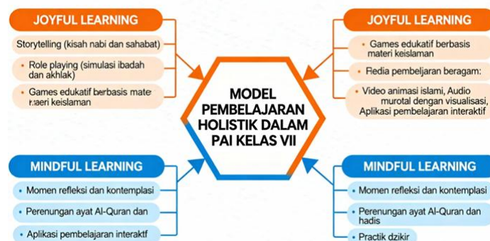
Gambar 3. Implementasi Model Pembelajaran Holistik

Implementasi model pembelajaran holistik dalam pendidikan Pendidikan Agama Islam (PAI) kelas VII di SMPN 5 Pekanbaru merepresentasikan paradigma baru yang mengintegrasikan tiga dimensi fundamental pembelajaran, yaitu joyful learning , Mindful learning , dan meaningful learning . Pendekatan holistik ini lahir sebagai respons terhadap kebutuhan transformasi pembelajaran PAI yang tidak hanya berorientasi pada pencapaian kompetensi kognitif semata, melainkan juga menekankan pembentukan karakter spiritual dan implementasi nilai-nilai keislaman dalam kehidupan nyata siswa. Model pembelajaran holistik mengakui kompleksitas proses pembelajaran sebagai sebuah ekosistem yang saling terkait, di mana aspek kegembiraan dalam belajar ( joyful ), kesadaran spiritual yang mendalam ( mindful ), dan relevansi makna pembelajaran ( meaningful ) harus diintegrasikan secara sinergis untuk menciptakan pengalaman pembelajaran yang komprehensif dan transformatif. Implementasi ketiga dimensi ini tidak hanya bertujuan meningkatkan motivasi dan partisipasi aktif siswa, tetapi juga memfasilitasi internalisasi nilai-nilai keislaman yang mendalam sehingga pembelajaran PAI dapat menjadi fondasi kokoh bagi pembentukan kepribadian muslim yang utuh dan berkarakter.