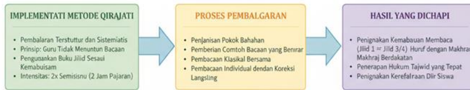
Gambar 2. Pengaruh Metode Qira'ati Secara Parsial

Hasil penelitian menunjukkan bahwa metode Qira'ati memberikan pengaruh yang signifikan terhadap kemampuan membaca Al-Qur'an siswa di SMA Negeri 11 Mandau Duri. Berdasarkan observasi yang dilakukan selama tiga bulan terhadap proses pembelajaran, teridentifikasi bahwa penerapan metode Qira'ati dilakukan secara terstruktur dan sistematis dengan mengikuti tahapan-tahapan yang telah ditetapkan dalam panduan metode tersebut. Guru memulai pembelajaran dengan menjelaskan pokok bahasan yang akan dipelajari, kemudian memberikan contoh bacaan yang benar dengan melafalkan huruf-huruf hijaiyah sesuai makhrajnya dan menerapkan hukum tajwid yang tepat. Setelah pemberian contoh, siswa secara bersama-sama mengikuti bacaan guru dalam sesi klasikal, kemudian dilanjutkan dengan pembacaan individual dimana setiap siswa diberi kesempatan membaca secara bergantian sementara siswa lainnya menyimak.