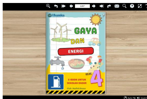
Gambar 1. Tampilan Cover E-book

Hasil dari penelitian ini berupa ebook berbantuan aplikasi Flip PDF Corporate Edition materi gaya dan energi di kelas IV sekolah dasar.