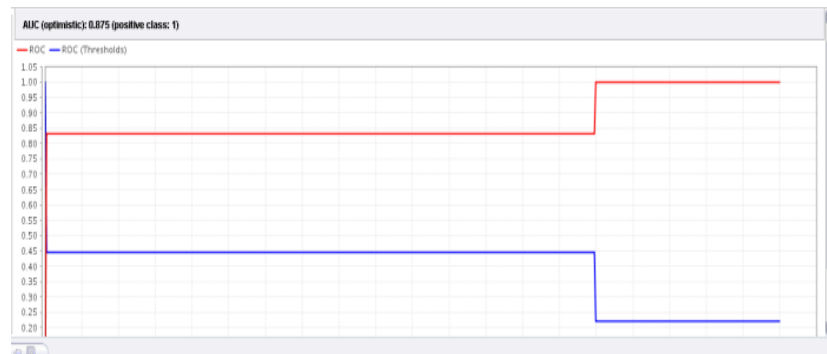
Gambar 2. Kurva ROC dengan Metode KNN