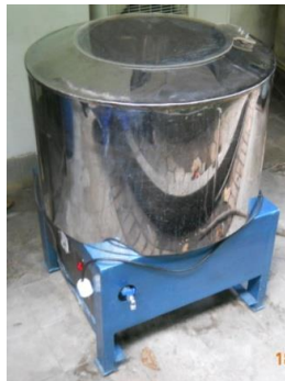
Gambar 3. Alat pemisah filtrat kedelai dan ampas tipe bubuk kedelai tampak perspektif depan

Pengujian konsep dalam penelitian ini merupakan tolak ukur keberhasilan dalam perancangan alat pemisah filtrat kedelai dan ampas. Indikator keberhasilan perancangan alat adalah melakukan perbandingan densitas atau kerapatan filtrat kedelai proses penyaringan manual dengan densitas filtrat kedelai hasil penyaringan menggunakan alat. Pengujian alat hasil rancangan dilakukan menggunakan bubuk kedelai siap saring yang memiliki densitas 1,03 \times 10^3 \text{ kg/m}^3 . Setelah dilakukan proses penyaringan dengan menggunakan alat hasil rancangan diperoleh nilai densitas rerata filtrat kedelai adalah 1,01 \times 10^3 \text{ kg/m}^3 . Nilai densitas rerata filtrat kedelai dengan proses penyaringan secara