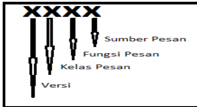
Gambar 1. MTI ISO-8583

Tipe Indikator Pesan ISO-8583 berupa kelas pesan ( Message Class ), fungsi pesan ( Message Function ), sumber pesan ( Message Origin ).