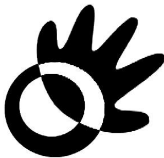
Gambar 4. Grafis penggabungan elemen desain logo

Kedua grafis tersebut tidak berdiri sendiri-sendiri, melainkan menjadi satu kesatuan, dimana grafis tangan kuning terlihat menggapai lingkaran cincin berwarna biru, yang dapat dilihat sebagai petanda dari tagline “ The World in Your Hand ”.