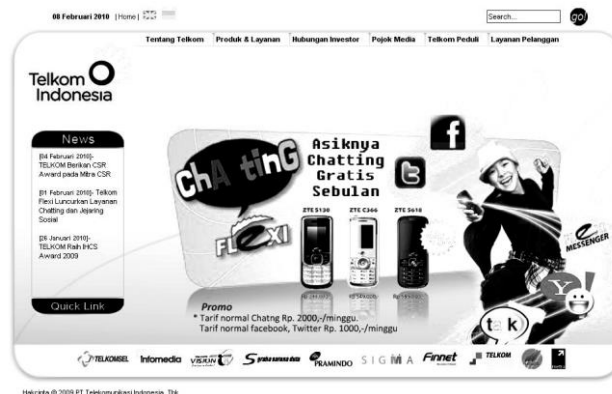
Gambar 6. Tampilan muka situs web PT Telkom