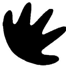
Gambar 3. Grafis elemen desain logo PT Telkom

Sedangkan grafis stililasi tangan dengan lima jari mengembang berwarna kuning cerah dapat sebagai petanda dari lima pilar bisnis PT Telkom dan petanda harafiah dari kata “ Your Hand ” pada tagline “ The World in Your Hand ”.