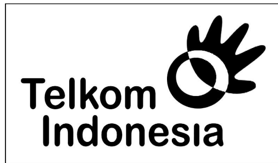
Gambar 1. Logo PT Telekomunikasi Indonesia