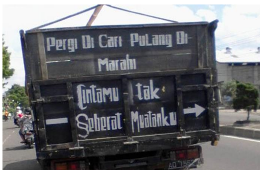
Gambar 17 Grafiti Bak Truk Genre Idiom Bahasa Indonesia

Idiom merupakan salah satu genre grafiti bak truk. Idiom yang ditemukan umumnya ditulis dalam bahasa Indonesia. Misalnya, grafiti bak truk (Gambar 17) bertuliskan idiom “Cintamu tak seberat muatanku”. Tulisan itu jika dikaitkan dengan aktivitas sopir mengangkut muatan barang dari satu ke kota lain; dari satu daerah ke daerah lain tentu dapat dipahami secara baik. Pesan di balik grafiti itu menegaskan bahwa cinta seseorang (mungkin kekasih si sopir) itu tidak seberat muatan yang dibawanya dengan truknya. Muatan di truknya itu jauh lebih penting daripada rasa cinta seseorang yang mungkin kurang tulus, kurang menerima, atau kurang menghargai diri si sopir selama ini.