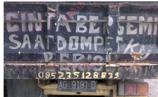
Gambar 15 Grafiti Bak Truk Genre Pantun Kilat Bahasa Indonesia

tulisan itu ada bunyi rima /i/ pada kata bersemi dan berisi . Pesan di balik pantun kilat itu bahwa saat si sopir memiliki pendapatan atau gaji yang lumayan, maka cinta seseorang (mungkin istri atau kekasih hatinya) bersemi. Dan sebaliknya, jika pendapatan si sopir berkurang, maka cinta seseorang tadi menghilang.