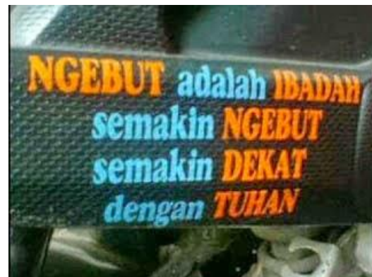
Gambar 10 Grafiti “Ngebut adalah ibadah, semakin ngebut semakin dekat dengan Tuhan”

Fungsi kognitif terlihat pada Gambar 10 dan 11. Gambar 10 grafiti bak truk bertuliskan, “Ngebut adalah ibadah. Semakin ngebut, semakin dekat dengan Tuhan.” Lewat grafiti itu, si sopir bermaksud menyampaikan pesan bahwa cara dia mengendarai truk itu dengan mengebut (biasanya disebut ngebut), dan mengebut itu bagian dari ibadah, layaknya salat. Dengan demikian, si sopir truk hendak menyampaikan pesan bahwa mengebut itu bagian dari kerjanya sehari-hari, dan para pengguna jalan lainnya harap maklum. Selain itu, mengebut sangat berisiko terhadap terjadinya kecelakaan di jalan sehingga kalimat “semakin ngebut semakin dekat dengan Tuhan” itu bermakna mengebut dapat mengakibatkan kematian.