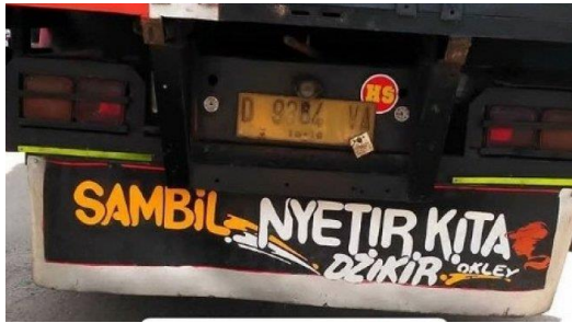
Gambar 8 Grafiti “Sambil Nyetir Kita Dzikir”

kita dzikir” itu lebih tepatnya mengarah ke makna nomor 3, yaitu perbuatan mengucapkan zikir.