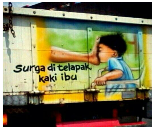
Gambar 18 Grafiti Bak Truk Genre Idiom “Surga di Telapak Kaki Ibu”