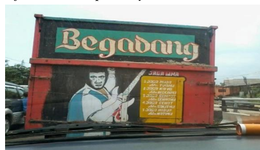
Gambar 19 Grafiti Bak Truk Genre Judul Lagu “Begadang”

Judul lagu merupakan salah satu genre wacana grafiti bak truk. Salah satu judul lagu yang digunakan sebagai grafiti bak truk adalah “Begadang” karya Rhoma Irama (Gambar 19, Rhoma Irama merupakan penyanyi Indonesia yang terkenal dengan julukan “Raja Dangdut”). Ia banyak menghasilkan lagu-lagu terkenal di masyarakat Indonesia, seperti “Istri Salehah”, “Lari Pagi”, “Mirasantika”, dan “Judi”. Melalui grafiti bak truk bertuliskan salah judul lagu Rhoma Irama itu, si sopir hendak menyampaikan pesan kepada pembaca grafiti agar tidak terlalu sering begadang setiap malam. Seperti bunyi lirik-liriknya, “ Begadang jangan begadang/ Kalau tiada artinya/ Begadang boleh saja, asal ada perlunya/... ”.