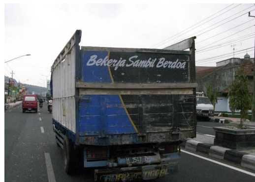
Gambar 1 Contoh Grafiti Bak Truk

Di antara kelima arti di atas, tampaknya yang sesuai dengan grafiti bak truk ialah arti nomor 3, satuan bahasa terlengkap yang direalisasikan dalam bentuk karangan atau laporan utuh, seperti novel, buku, artikel, pidato, atau khotbah. Dengan demikian, grafiti bak truk dapat dinyatakan sebagai satuan bahasa terlengkap yang direalisasikan dalam bentuk karangan atau laporan utuh. Menurut Kamus Besar Bahasa Indonesia Daring (Badan Pengembangan dan Pembinaan Bahasa, 2016), grafiti adalah coretan dalam berbagai bentuk (kata, simbol, dan sebagainya) dan warna yang terdapat pada tembok atau dinding properti umum.