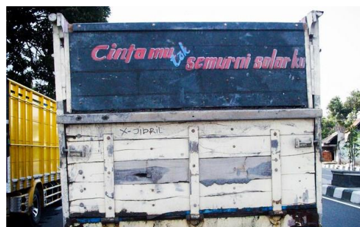
Gambar 12 Grafiti “Cintamu tak semurni solarku”

Fungsi komunikatif terlihat pada Gambar 12. Gambar 12 grafiti bak truk bertuliskan, “Cintamu tak semurni solarku.” Lewat grafiti itu, si sopir hendak menyampaikan pesan bahwa cinta pembaca grafiti itu tidak semurni solar yang digunakan oleh si sopir dalam mengendarai truknya. Solar itu sendiri merupakan bahan bakar minyak untuk mesin diesel, lebih kental daripada minyak tanah. Dengan demikian, jika si sopir mengatakan, “cintamu tak semurni solarku”, artinya solar yang ia gunakan untuk mengendarai truknya itu benar-benar asli, bukan oplosan. Atau, bisa juga arti dari tulisan “cintamu tak semurni solarku” adalah cinta pembaca grafiti yang setengah-setengah atau kurang tulus, dan berbeda dengan solar yang digunakan oleh si sopir dalam mengendarai truknya.