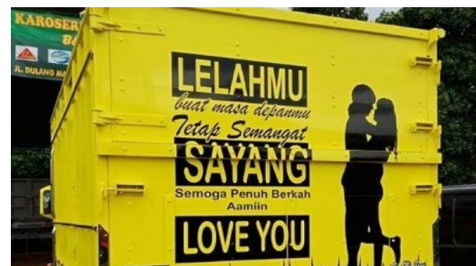
Gambar 5 Grafiti Bak Truk dalam Bahasa Inggris

Gambar 5 merupakan contoh grafiti bak truk dalam bahasa Inggris. Di dalam grafiti itu tertera tulisan berbunyi, “Lelahmu buat Masa Depanmu. Tetap Semangat Sayang. Semoga Penuh Berkah Aamiin. Love you.” Frasa Love you berasal dari bahasa Inggris yang artinya ‘mencintai kamu’. Tulisan ini semacam pesan dari istri sopir kepada suaminya yang sedang bekerja sebagai sopir truk agar tetap semangat dalam bekerja demi masa depan keluarganya.