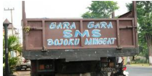
Gambar 4 Grafiti Bak Truk dalam Bahasa Jawa

berasal dari bahasa Jawa yang artinya ‘suami atau istri’. Ditambah kata ganti -ku menjadi Bojoku berarti ‘suamiku’ atau ‘istriku’. Kata minggat juga berasal dari bahasa Jawa yang artinya ‘pergi dari rumah’. Biasanya, sopir truk itu laki-laki, maka dalam konteks tulisan “Gara-Gara SMS Bojoku Minggat”, berarti yang pergi dari rumah si sopir adalah istrinya.