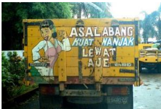
Gambar 11 Grafiti “Asal Abang kuat nanjak lewat aje”

dilengkapi dengan gambar perempuan yang berparas cantik, berbaju putih dan merah jambu. Melalui grafiti itu, si sopir hendak menyampaikan pesan bahwa jika pengendara lain ingin menyalip truknya, maka dipersilakan, asalkan pengendara lain itu kuat dalam posisi menanjak.