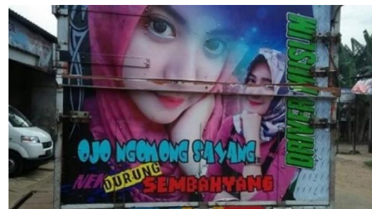
Gambar 16 Grafiti Bak Truk Genre Pantun Kilat Bahasa Jawa

Lain pantun kilat bahasa Indonesia, lain pula pantun kilat bahasa Jawa. Gambar 16 grafiti bak truk genre pantun kilat berbahasa Jawa tertulis, “Ojo ngomong sayang, nek durung sembahyang”, artinya ‘Jangan ngomong sayang, jika belum sembahyang’. Pada tulisan itu ada bunyi rima /ŋ/ pada kata sayang dan sembahyang . Selain tulisan, ada pula gambar dua orang perempuan berusia muda yang berjilbab dan berparas cantik. Pesan di balik pantun kilat itu bahwa dua perempuan itu seolah berkata kepada kekasihnya (barangkali si sopir truk) agar salat dulu, baru kemudian bertemu dengan dirinya.