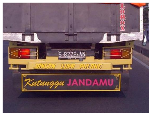
Gambar 7 Grafiti “Kutunggu Jandamu”

Gambar 7 grafiti bak truk bertuliskan, “Kutunggu Jandamu”. Lewat grafiti itu tersampaikan pesan bahwa si sopir truk sedang menunggu status janda seseorang. Memang tidak tertulis nama seseorang yang ditunggu status jandanya seperti Gambar 6. Namun demikian, grafiti bak truk Gambar 7 menegaskan bahwa si sopir sedang menunjukkan urusan pribadinya kepada orang lain, terlepas dari benartidaknya status perkawinan si sopir. Selain tulisan “Kutunggu Jandamu”, ada pula tulisan “Jangan Lupa Pulang” yang bermaksud agar si sopir tidak lupa pulang ke rumahnya.