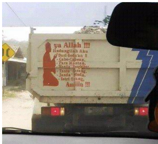
Gambar 14 Grafiti Bak Truk Genre Doa