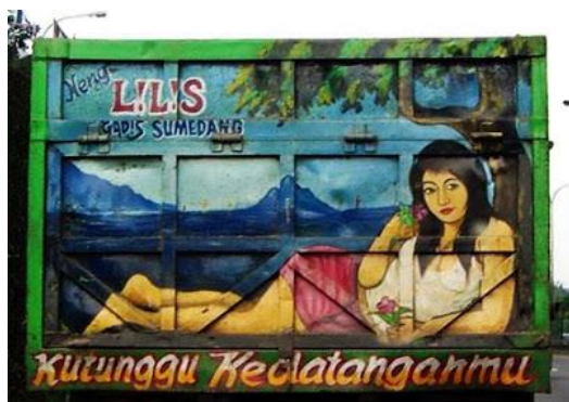
Gambar 6 Grafiti “Neng Lilis Gadis Sumedang, Kutunggu Kedatanganmu”

Fungsi ekspresif terlihat pada Gambar 6 dan 7. Gambar 6 grafiti bak truk bertuliskan, “Neng Lilis Gadis Sumedang, Kutunggu Kedatanganmu”. Neng itu nama panggilan bagi gadis yang belum menikah di daerah Jawa Barat. Grafiti itu juga dilengkapi gambar seorang gadis berambut hitam sebahu, berkaus pendek putih, dan memakai rok pendek merah. Dengan adanya tulisan dan gambar itu, tersampaikan pesan bahwa si sopir truk sedang menunggu kedatangan gadis impiannya bernama Neng Lilis yang merupakan gadis asal Sumedang, Jawa Barat.