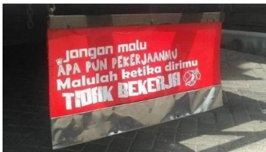
Gambar 3 Grafiti Bak Truk dalam Bahasa Indonesia

Gambar 3 merupakan contoh grafiti bak truk dalam bahasa Indonesia. Di dalam grafiti itu tertera tulisan yang berbunyi, “Jangan malu, apa pun pekerjaanmu. Malulah ketika dirimu tidak bekerja.” Frasa tidak bekerja ditulis dengan huruf kapital yang memiliki pesan penting kepada para pembaca grafiti itu agar tidak usah malu dengan pekerjaan yang dilakukan, seperti bekerja sebagai sopir. Alih-alih begitu, malulah ketika kita, termasuk para pembaca grafiti itu, justru tidak bekerja apa pun.