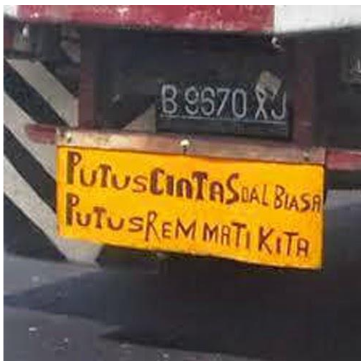
Gambar 9 Grafiti “Putus Cinta Soal Biasa, Putus Rem Mati Kita”

Sementara itu, Gambar 9 grafiti bak truk bertuliskan, “Putus Cinta Soal Biasa, Putus Rem Mati Kita”. Lewat grafiti itu, si sopir hendak menyampaikan pesan atau nasihat kepada para pembaca grafiti bahwa putus cinta itu soal biasa, tapi putus rem itu berbahaya bahkan bisa menyebabkan kematian bagi si sopir atau semua pengguna kendaraan. Penggunaan kata kita menunjukkan bahwa si sopir seolah-olah mengajak pembaca grafiti untuk menganggap putus cinta itu hal biasa, sedangkan putus rem itu hal berbahaya bagi dirinya sendiri dan orang lain yang juga sama-sama pengguna kendaraan di jalan raya.