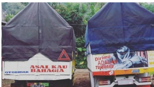
Gambar 20 Grafiti Bak Truk Genre Judul Lagu “Asal Kau Bahagia”

Lain judul lagu “Begadang”, lain pula judul lagu “Asal Kau Bahagia” (Gambar 20). Lagu “Asal Kau Bahagia” karya Armada tentang kisah seseorang yang merelakan kekasih hatinya pergi dengan orang lain asalkan bahagia. Seperti lirik-lirik lagunya, “ Katakanlah sekarang bahwa kau tak bahagia/ Aku punya ragamu tapi tidak hatimu/ Kau tak perlu berbohong kau masih menginginkannya/ Kurela kau dengannya asal kan kau bahagia. ” Lewat grafiti itu, si sopir ingin menyampaikan pesan bahwa dirinya akan bahagia bilamana kekasihnya juga berbahagia dengan orang lain.