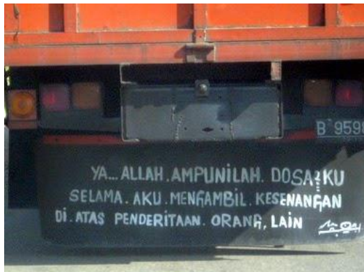
Gambar 13 Grafiti Bak Truk Genre Doa

berupa doa, “Ya Allah, lindungilah aku dari godaan cabe-cabean, para mantan, wanita 2 penghibur, tante 2 girang, janda 2 muda, istri orang. Amiiin!” Melalui dua buah grafiti itu, diperoleh pesan bahwa si sopir truk selalu berdoa kepada Allah Swt. agar dosa-dosa dirinya mohon diampuni dan dirinya dilindungi dari segala macam godaan, seperti cabe-cabean, para mantan (pacar/kekasih), wanita penghibur, tante girang, janda muda, dan istri orang lain.